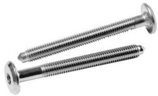
TABULKA MÍSTNOSTÍ 2.N.P.